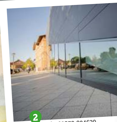
2. Stadt- und Technikmuseum Ludwigsfelde Im alten Bahnhofsgebäude mit modernem Anbau finden Sie das Stadt- und Technikmuseum. Hier erwartet Sie Industriegeschichte seit 1936 zum Anfassen. Bestaunen Sie einen Flugzeugmotor der damaligen Daimler-Benz-Produktion oder Roller der Serien Pitty, Wiesel, Berlin und Troll. Sogar die legendären W50 und L60 LKWs der DDR sind im Original zu sehen. Auch die stadtgeschichtliche Entwicklung vom slawischen Dorf zum modernen Ludwigsfelde wird anschaulich dargestellt. Ein Besuch lohnt sich! Tel.: 03378.804620, Mi.-Fr. 10 bis 15 Uhr, Sa. und So. 13 bis 17 Uhr, www.museum-ludwigsfelde.de