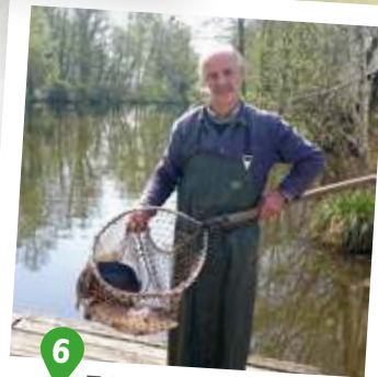
6. Fischereibetrieb Blankensee Tel.: 033731.15563, www.flaemingforelle.de/blankensee