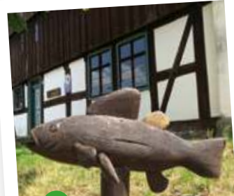
5. Das ist das Heimatmuseum Tel.: 033 731- 800 11, Mi - Fr 10.00 - 12.00 & 13.00 - 17.00 Uhr, Sa - So und feiertags 13.00 - 17.00 Uhr www.bauernmuseum-blankensee.de