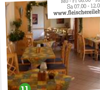
11. Akzent-Parkhotel Trebbin Die Spezialitäten unseres Hauses, der Elsässer Flammkuchen und Pfälzer Weine, treffen auf regionale Produkte aus Teltow-Fläming! Tel.: 033731.710, Restaurant: Mo - Sa 17.30 - 20.30 Uhr www.parkhotel-trebbin.de