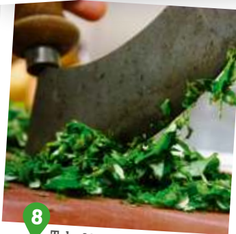
8. Kräuterkate Glau Tel.: 033731-700 586, Do - So 11.00 - 17.00 Uhr sowie nach Vereinbarung www.krauterkateglau.de

In dem urgemütlichen Wildkräuterlokal lässt es sich nach der Wanderung durch das Wildgehege hervorragend entspannen. Die Kräuterpädagoginnen sind mit Kräuterwissen bei der Hand und zeigen gerne verschiedene Wildkräuter und deren Verwendung.