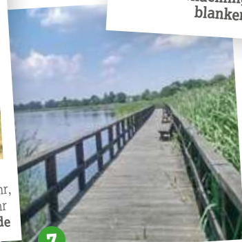
7. Bohlensteg Blankensee