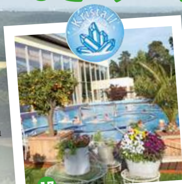
17. Kristall Saunatherme Ludwigsfelde Textilfreies Baden auf höchstem Niveau in einer der schönsten Thermen Brandenburgs in Ludwigsfelde bei Berlin. Ausgestaltet in edlem Marmor und vielen liebevollen Details, zeigt sich die Kristall Saunatherme Ludwigsfelde als wahre Oase der Entspannung und Erholung. Die großzügig angelegte Saunatherme empfängt Sie mit wohlthuender Wärme - einfach tief durchatmen und Stress und Hektik weit hinter sich lassen. Tel.: 03378.518 79-0, So - Do 09.00 - 22.00 Uhr, Fr - Sa 09.00 - 23.00 Uhr www.kristall-saunatherme-ludwigsfelde.de