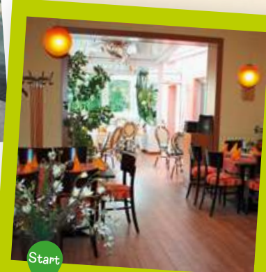
Gasthof & Pension „Zum Löwen“ Auf dem Parkplatz unseres Gasthofes können Sie Ihr Auto sicher abstellen oder Ihre E-Bikes kostenlos aufladen. Gerne können Sie sich im Restaurant etwas stärken, bevor Sie zu Ihrer Tour aufbrechen. Restaurant ab 12.00 Uhr geöffnet - Ruhetage Di. und Mi. Pension durchgehend geöffnet. Tel.: 03378.202880, Restaurant: Do - Mo 12.00 - 22.00 Uhr www.zum-loewen.net

Im alten Bahnhofsgebäude mit modernem Anbau finden Sie das Stadt- und Technikmuseum. Hier erwartet Sie Industriegeschichte seit 1936 zum Anfassen. Bestaunen Sie einen Flugzeugmotor der damaligen Daimler-Benz-Produktion oder Roller der Serien Pitty, Wiesel, Berlin und Troll. Sogar die legendären W50 und L60 LKWs der DDR sind im Original zu sehen. Auch die stadtgeschichtliche Entwicklung vom slawischen Dorf zum modernen Ludwigsfelde wird anschaulich dargestellt. Ein Besuch lohnt sich!