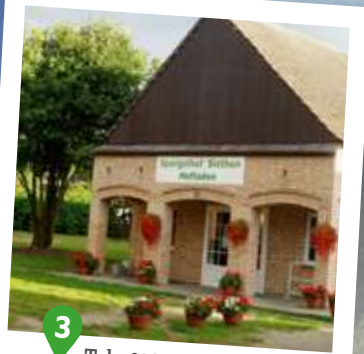
3. Spargelhof und Kirche in Siethen Gegenüber der Kirche befindet sich der Spargelhof Siethen mit eigenem Hofladen und vielen regionalen Spezialitäten, Obst & Gemüse, Kaffee & Kuchen sowie guten Tipps über die Region. Tel.: 03378.874338, Hofladen ab April: täglich 08.00 - 20.00 Uhr www.spargelhof-siethen.de