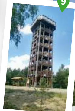
9. Aussichtsturm am Löwendorfer Berg

Nach dem steilen Weg werden Sie mit einer wunderbaren Aussicht über die Baumkronen hinweg auf die umliegende Landschaft belohnt - bei klarem Wetter können Sie sogar den Berliner Fernsehturm in der Ferne erkennen. Es lohnt sich auf jeden Fall!