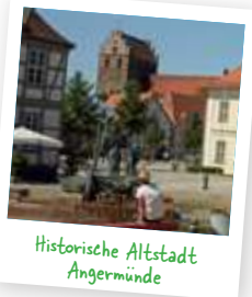
Historische Altstadt Angermünde

Von Schmargendorf geht es links nach Angermünde zur Straußenfarm. Haben Sie schon einmal ein Straußenei probiert? Die großen Vögel dürfen aus der Nähe betrachtet werden und der Hofladen hält tolle Produkte des Laufvogels bereit. Vorbei am einzigen Tierpark der Uckermark führt der Weg zurück zum Bahnhof oder in die historische Altstadt . Sie möchten mehr entdecken und erleben? Dann bleiben Sie für einige Tage und verbringen Sie einen Wellness-Abend im SPA Kranich-Insel im Flair Hotel Weiss und nutzen Sie weitere Rad- und Wanderwege der Region, um sich zu erholen.