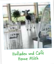
Hofladen und Café Henne Milch

Fahren Sie jetzt über die Ortsverbindungsstraße durch die sanft hügelige Landschaft über Zuchenberg an Pferdekoppeln vorbei nach Schmargendorf. Direkt neben dem Molkereibetrieb wurde das Erlebniszentrum Hemme-Milch mit Hofladen und Café eröffnet. Der Blick aus der hohen Glasfassade ist einzigartig schön. Stärken Sie sich mit einem Käsekuchen nach alter Rezeptur oder lassen Sie sich eine Kühltasche mit regionalen Produkten füllen.