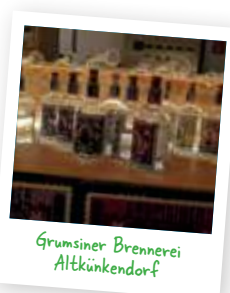
Grumsiner Brennerei Altkündendorf

An Fischteichen vorbei geht es nach Wolletz. Geheimtipp: Vor dem Ortsausgang führt links ein Pfad zur Uferpromenade mit Seeestieg. Nutzen Sie die Badezeit, um sich für die weitere Fahrt zu erfrischen, dann geht es nach Altkündendorf zum Weltnaturerbe Buchenwald Grumsin . Als weltweit einer der schönsten Wälder wurde ein Teil des Grumsins als Bestandteil des UNESCO-Weltnaturerbes Buchenurwälder der Karpaten und Alte Buchenwälder Deutschlands aufgenommen.